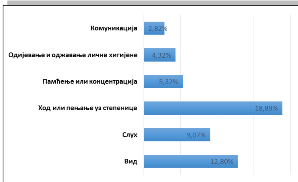
Графикон бр. 2 : Становништво старости 65 година и више са потешкоћама (према врсти)